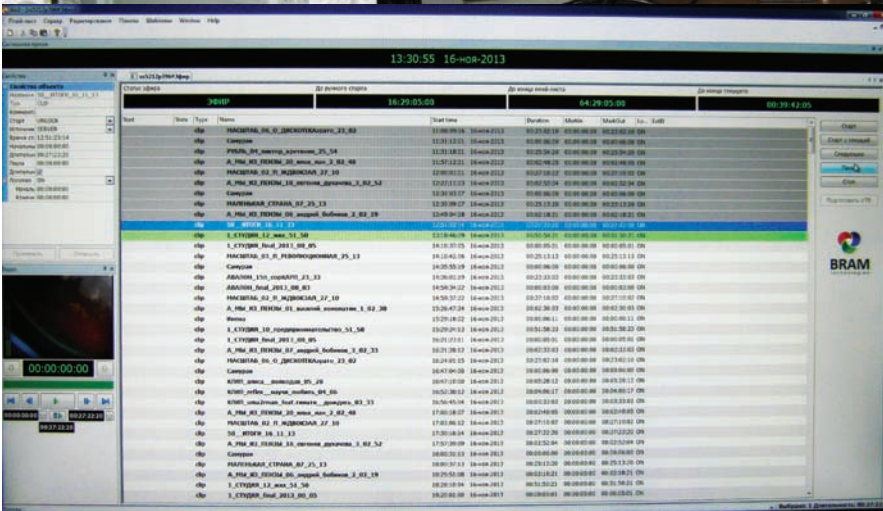
Впечатительное расписание платформы Azimuth

телерадиокомпаний и комплексной автоматизации вещания телеканала «Экспресс» в кабельной сети Пензы, население которой составляет около 600 тыс. человек. А после запуска регионального цифрового мультиплекса планируется вхождение транслируемого в кабельной сети телеканала в эфирный пакет РТРС-3 для вещания на всей территории Пензенской области.