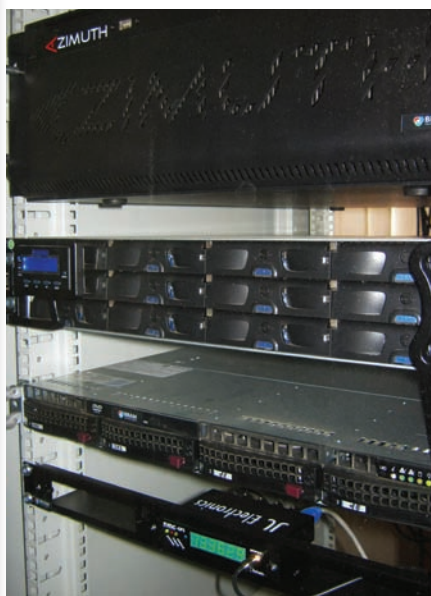
Серверная платформа Azimuth