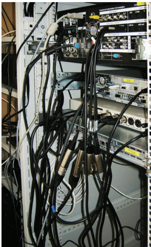
Стойка с оборудованием – вид сзади

Оборудование работает в штатном режиме уже более полугода, не создавая телеканалу проблем. Оно используется в круглосуточном режиме, выполняя функции управления медиаресурсами