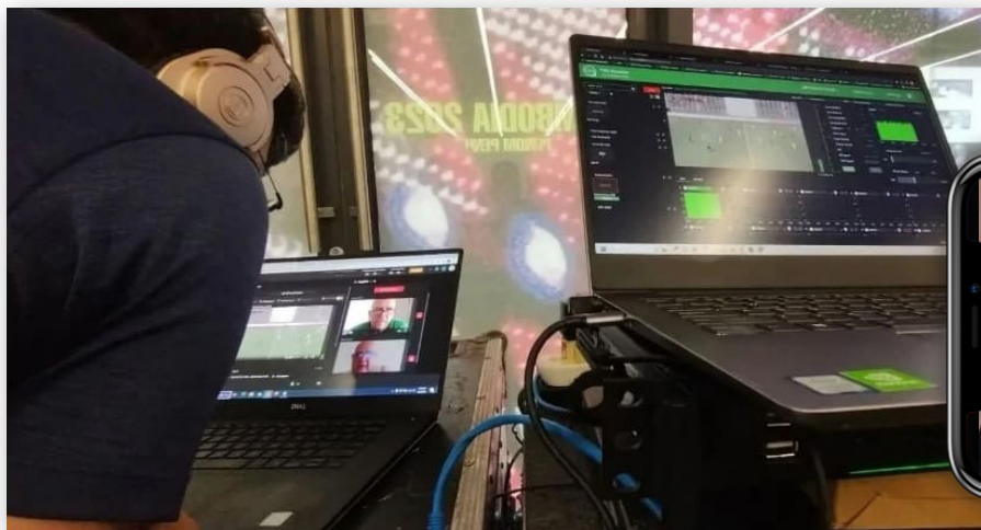
Решения TVU на Играх SEA 2023

Опираясь на фирменную технологию TimeLock, система TVU Remote Commentator обеспечивала четкую синхронизацию сигналов видео и звука, поступающих из разных мест, благодаря чему можно было точно вести комментирование и взаимодействовать с ведущим в эфире. К тому же облачный TVU-микросервис настройки упрощал работу со звуком для Mediacorp. Гибкие микросервисы TVU обеспечивали многоязыковую поддержку, помогали работать комментаторам, использовались на разных платформах доставки контента, таких как вещательные ТВ-каналы, стриминговые сервисы и соцсети. Экосистема TVU для трансляции в дистанционном режиме предоставила Mediacorp эффективный, точно синхронизированный рабочий процесс для проведения прямых эфиров, что позволило корпорации повысить уровень своего международного комментирования, увеличив штат комментаторов. ▶