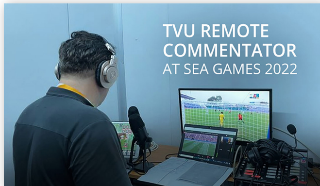
Использование TVU Remote Commentator на Играх 2022 года

Находившиеся в разных местах комментаторы применяли TVU Remote Commentator для интерактивного живого комментирования состязаний, работая в дистанционном режиме.