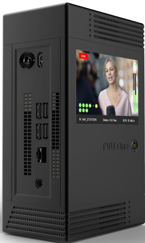
Мобильный передатчик TVU One