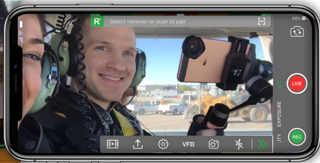
Мобильная потоковая трансляция с помощью приложения TVU Anywhere