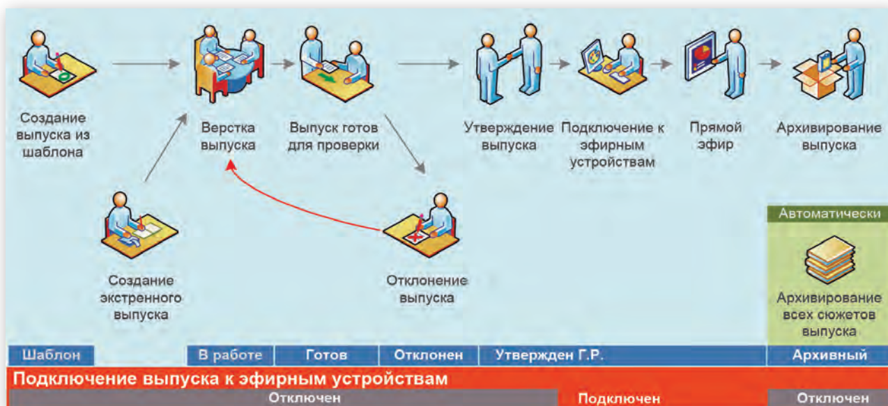
Схема управления новостными выпусками

В miraNEWS предусмотрена возможность и оперативного внесения изменений при работе в прямом эфире. Тут, если возникает необходимость, редакторы, режиссер выпуска и его ассистенты могут изменить текст, выводимый на экран суфлера, скорректировать графику, добавить сюжет или, наоборот, убрать из выпуска