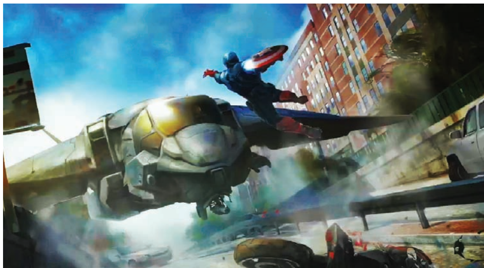
Концепт-арт фильма «Первый мститель: Другая война»

«Учитывая традиционный костюм Капитана Америка, который заставлял фиксировать взгляд на области торса, нам пришлось задуматься, как сохранить в новом варианте красное, белое,