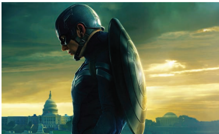
Главный герой фильма

«Мы заставили Энтони Маки полетать, – говорит координатор трюков Томас Робинсон Харпер. – Откалибровали страховку, мы могли подбросить его в воздух на 20 м и приземлить на заранее установленный маркер, да так, чтобы актер мог сохранить равновесие и плавно сменить полет на ходьбу. Потребовалось некоторое время, чтобы выбрать правильную скорость разгона, полета и торможения. К счастью, Маки поддерживает хорошую спортивную форму и может похвастаться отменной координацией движений. Это существенно облегчило задачу всем, включая его самого и каскадеров».