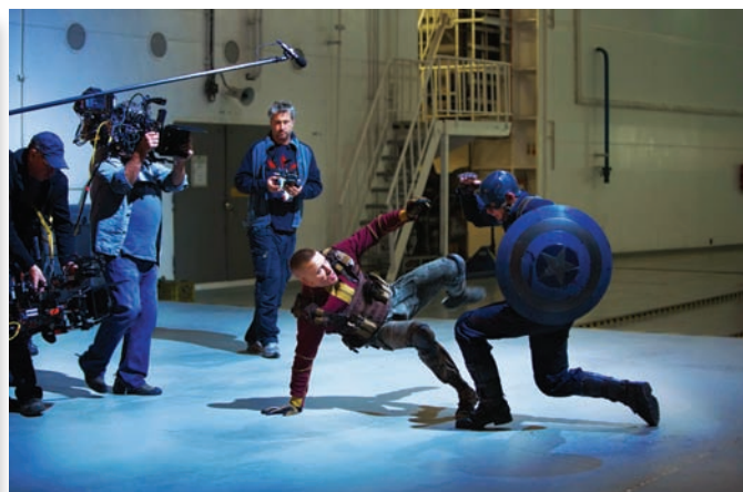
В съемках одной из сцен принял участие профессиональный боец восточных единоборств