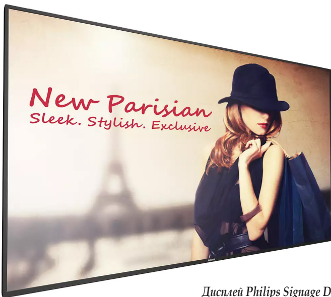
Дисплей Philips Signage D-line

возможность проведения акций привлечения внимания в фойе, когда все дисплеи синхронизируются для одновременного отображения специфического контента, который невозможно не заметить. В качестве примеров можно привести рекламу комбинированных предложений питания, различных событий и др.