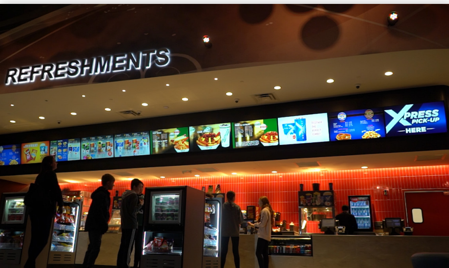
Зона питания в фойе кинотеатра

полнительные надежные средства связи между всеми кинотеатрами, а также создать новые возможности для получения дохода.