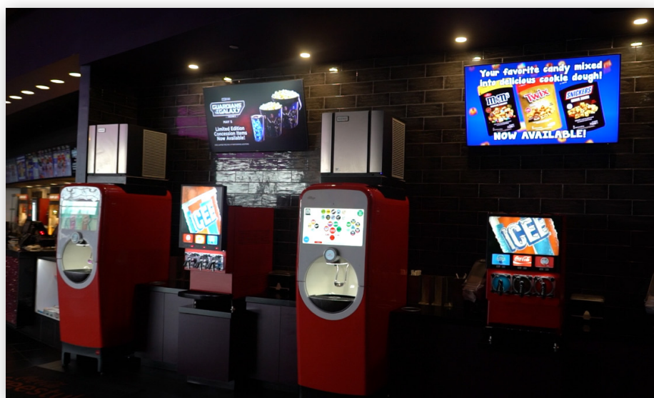
Информационные дисплеи в фойе кинотеатра

Дисплеи Philips Signage D-line и Videowall X-Line в сочетании с программной платформой DEEL Media также дают