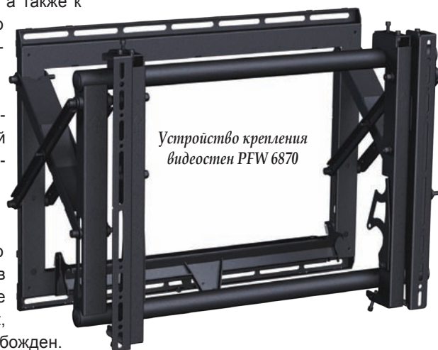
Устройство крепления видеостен PFW 6870

Предусмотрена также регулировка сервисного положения видеостены. То есть пользователь может в определенных пределах сам задать наклон рамы, когда она становится в сервисное положение. Это добавляет удобства для обслуживающего технического персонала.