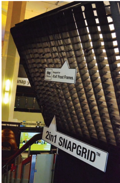
Решетка для панели Frost Frame

Решетки SNAPGRID хорошо продуманы, запатентованы и изготовлены с бескомпромиссным качеством. Благодаря запатентованной технологии SNAPGRID решетки автоматически раскладываются, как только они извлечены из сумки, и сохраняют форму даже в состоянии сильного нагрева и вне зависимости от собственного размера. Благодаря «умному» универсальному механизму крепления установка решетки на прибор выполняется за секунды. А специально разработанные высокопрочные ленты из текстиля делают решетки DoPchoice особенно надежными и долговечными. Все – от производства материала до сшивания решетки и финального контроля качества – делается в Германии. Что, несомненно, служит отличной рекомендацией.