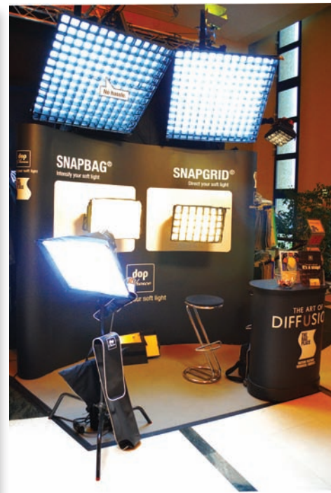
Самораскладывающиеся решетки и софтбоксы DoPchoice

Решетки SNAPGRID для панелей Frost Frame упрощают управление заполняющим освещением – с их помощью можно легко и гибко управлять заполняющим светом от панелей Frost Frame без применения флагов и ширм. Нужна всего минута, чтобы закрепить