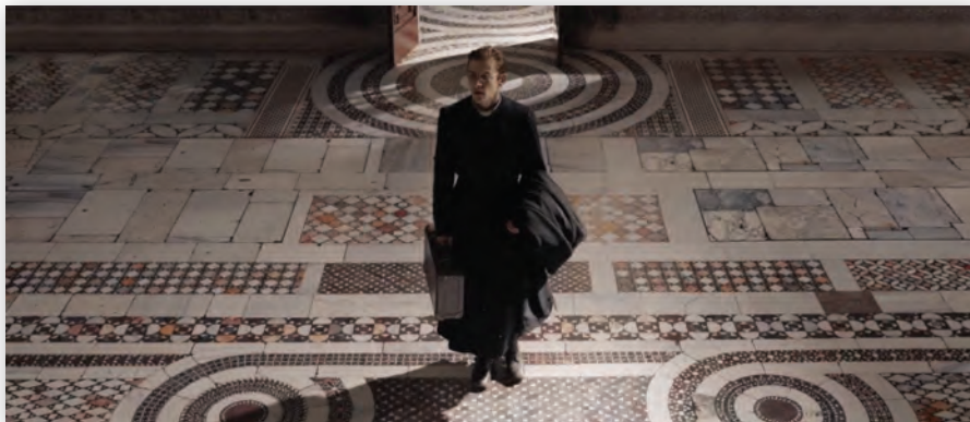
Кадр из фильма «Истина делает свободным»