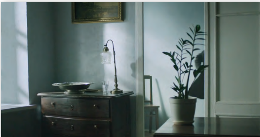
Кадр из этюда «Дом» представителей Латвийской академии музыки и театра