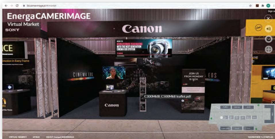
Виртуальный стенд Canon

В завершение хочется сказать две вещи. Во-первых, Camerimage – это настоящее кино, а не кинокомиксы. Здесь можно посмотреть отличные картины с профессиональной игрой актеров, филигранной работой операторов, натурными съемками и т.д. А во-вторых, несмотря на почти безупречное проведение виртуального EneгаCamerimage 2020, и его организаторы, и номинанты, и зрители сходятся в одном – ничто не заменит реального общения, настоящего кинопоказа и атмосферы праздника кино. Поэтому все ждут EneгаCamerimage 2021 и надеются, что он состоится в живую. ▶