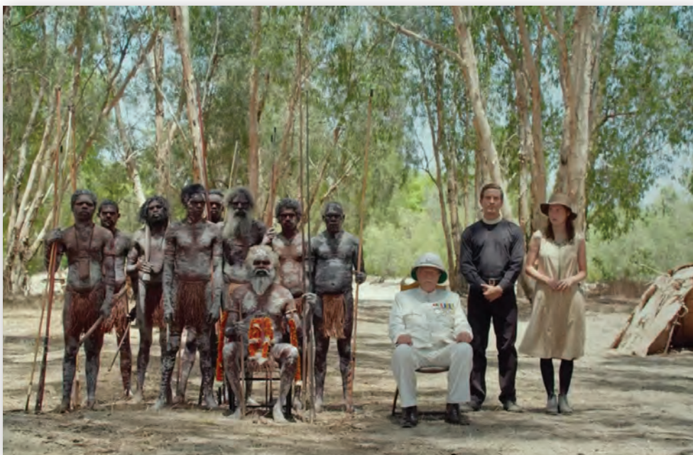
Кадр из картины «Высота»

В категории полнометражных лент снова оказалось много закрытых для просмотра вне Польши фильмов. Но и тут повезло – один из двух лучших оказался доступен. И что интересно – снят он в России, в чукотском поселке Лорино, где уклад жизни сегодня мало чем отличается от того, что было и 20, и 30, и 40 лет назад. Польским кинематографистам – оператору Петру Бернашу и режиссеру Мацею Цуске – удалось точно передать это на экране. Общие планы в фильме «Кит из Лорино» органично соседствуют с крупными планами и деталями, что формирует общую картину бытия людей на Чукотке, чья жизнь тесно связана с природой, а основным промыслом является китовый. Признаюсь, иногда было досадно видеть, как живут наши сограждане на пороге уже третьего десятилетия XXI века. Но документальное кино на то и документальное, что показывает все как есть.