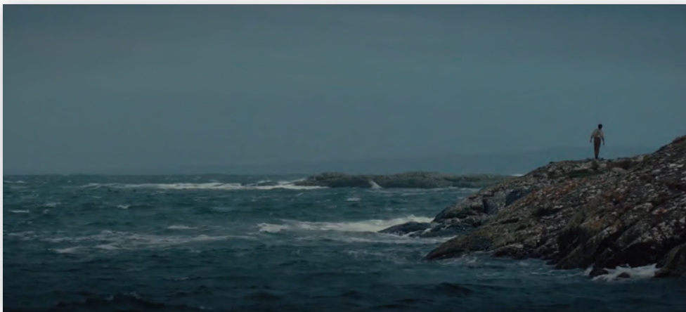
Кадр из фильма «Монстр»