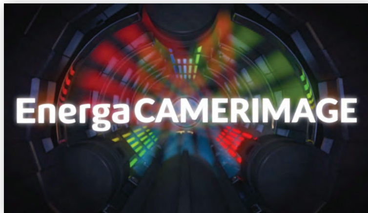
Титульная заставка фестиваля EnergаCamerimage 2020

Поэтому приведу только официальные данные об этом конкурсе. В нем участвовали 12 картин, и ни одной из нашей страны. С полным списком номинантов в этой и остальных категориях можно ознакомиться на веб-сайте фестиваля: www.camerimage.pl . Победителей определяло жюри под председательством режиссера Леха Маевски, которому помогли киноопера-