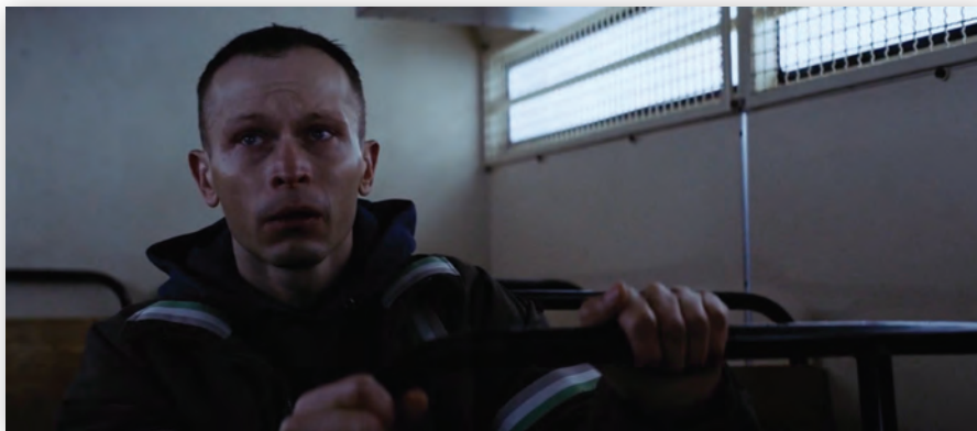
Кадр из фильма «25 лет невиновности»

щим пониманием того, как история должна выглядеть на экране. Во всяком случае, кинооператор сделал свою работу на «отлично». В ленте много темных кадров, поскольку главный герой в ней переживает сложный период, находится под воздействием темных сил. Но проработка каждого кадра сделана отменно. Не зря же лента не осталась без признания жюри.