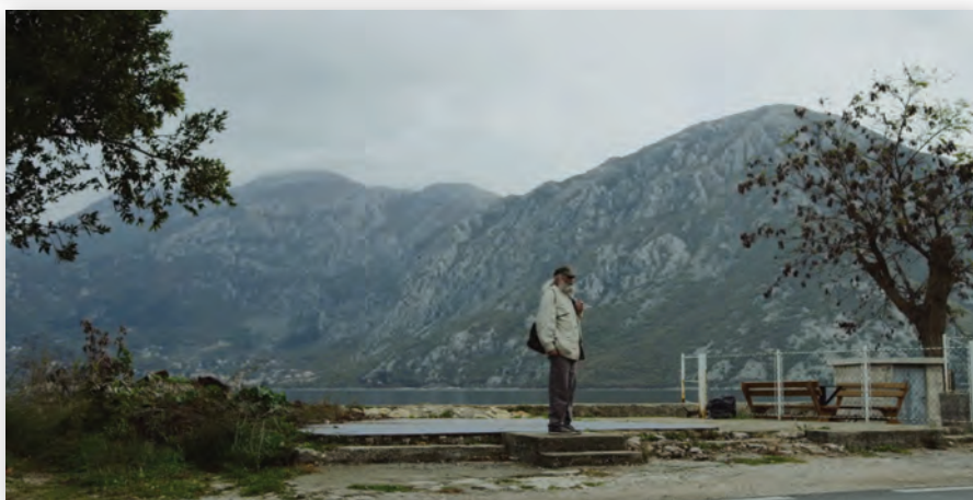
Кадр из ленты «Повестка дня»

Не менее мастерски поработал художник-постановщик, добившийся высокой степени достоверности применительно к каждому периоду