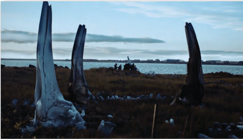
Кадр из картины «Кит из Лорино»