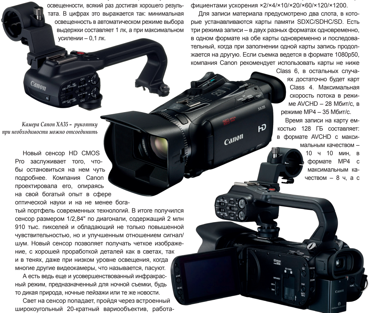
Камера Canon XA35 – рукоятку при необходимости можно отсоединить

время записи на карту емкостью 128 ГБ составляет: в формате AVCHD с максимальным качеством – 10 ч 10 мин, в формате MP4 с максимальным качеством – 8 ч, а с