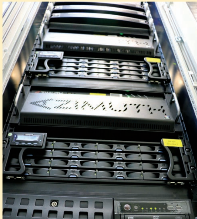
Стойка с видеосерверами Azimuth

Специалисты BRAM Technologies также приняли активное участие в сессиях конференции и выступили с докладом-презентацией по автоматизации телевизионного вещания. Помимо этого, во время круглых столов обсуждались планы и перспективы развития российского рынка телевидения в 2016 году.