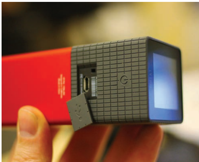
Разъем micro-USB на «теле» камеры