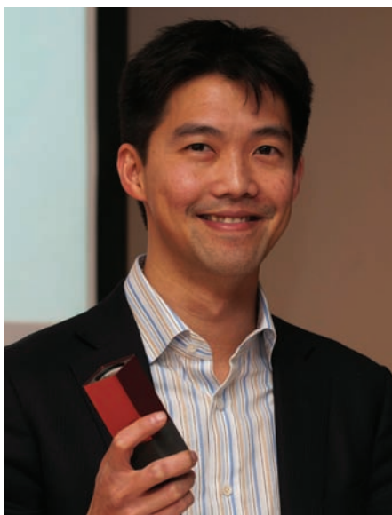
Рен Энджи с камерой Lytro

Фактически, записанное пленооптической камерой суммарное изображение содержит в себе не одно, а целое множество элементарных «картинок», и в одном снимке светового поля содержится намного больше информации, чем в традиционном файле jpeg, tiff или даже raw. Это так называемый «живой снимок», содержащий в себе множество слоев резкости. В этом смысле пленооптическая технология получения изображения очень близко подбиралась к голографической технологии, при которой в относительно толстом, по сравнению с длинами волн света, слое фоточувствительной эмульсии фиксируется не одно изображение, а множество, с различными векторами направленности. Используя специальные алгоритмы, можно в любой момент времени из суммарного изображения выбрать нужное – элементарное, и таким образом сфокусироваться на определенном объекте, или помещать весь кадр в фокус уже после того, как процесс съемки завершен. Кадр при этом создается практически мгновенно.