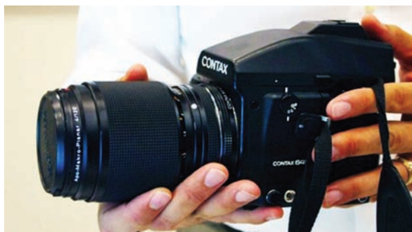
Прототип камеры светового поля на базе Contax 645

Режима Everyday вполне достаточно, чтобы получить «обычный» фотоснимок. Создать в этом режиме «живой снимок» тоже можно, хотя и придется отдельно постараться. Диапазон доступных фокусных расстояний всего 43...150 мм, и минимальная дистанция фокусировки достаточно велика, так что получить резкий передний план сложно. То есть просто «портрет на фоне» получится «живым» не всегда. А вот в режиме Creative уже больше возможностей – благодаря использованию всего 8-кратного диапазона трансфокации (43...340 мм) и свободному выбору точки максимальной резкости (она же – точка эк-