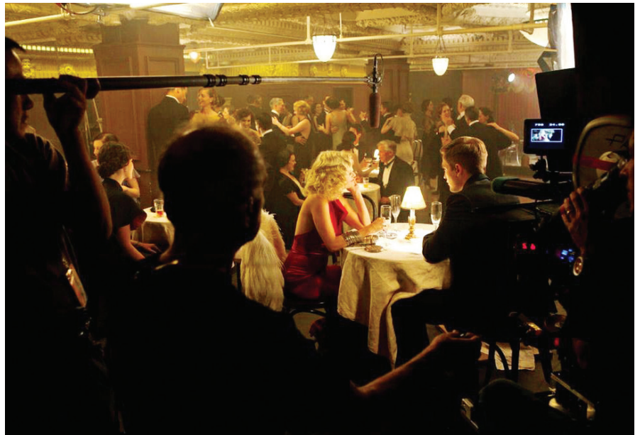
Съемки в интерьере

можно и нужно. Для этого существуют рамы – как для создания тени, так и для отраженного заполнения и рисунка. Важен правильный выбор диафрагмы, чтобы идеально высвеченный солнцем фон совпадал по яркости с первым планом. Самое комфортное состояние погоды для природы – пасмурный день. Иногда достаточно подсветить глаза героя, особенно на крупном плане. При этом можно превратить хмурый день в солнечный, не перегружая площадку приборами, перебивающими солнце. В интерьере использование света также имеет свою специфику – игрой света и тени, усилением заявленных в кадре источников света можно добиться нужного