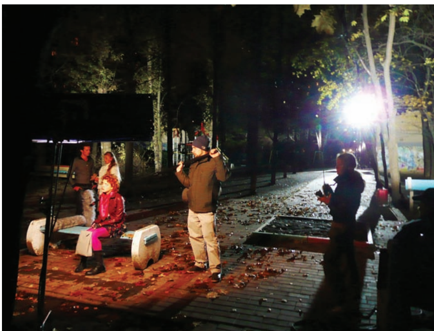
Ночная натура. Мощный контровой свет разбивает тьму

Следовательно, работа со светом имеет огромное значение в воплощении общего художественного замысла. О том, каким образом достигается тот или иной результат, речь пойдет в следующих статьях. ▶