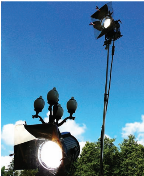
Дальние родственники - уличный фонарь и ответственный прибор

того на множество серий, не отягощен серьезной работой со светом. На это просто нет времени! Но в долгоиграющем ситкоме и нет необходимости в стильной насыщенной картинке. Главное, чтобы зритель следил за сюжетом, а эстетическое удовольствие не только от драматургии, но и от изображения, мы обычно ждем и получаем при просмотре штучного произведения – полнометражного кинофильма. На мой взгляд, чем длиннее сериал, тем схематичней и условнее вклад света в общий результат.