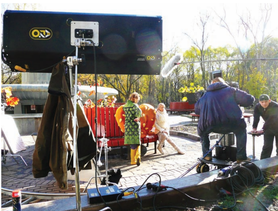
Солнце - главный осветительный прибор, с которым не поспоришь

В зависимости от поставленных задач, использование света при кино- и телесъемке имеет определенные варианты. При создании сериалов свет, за редким исключением, всего лишь «помогает» увидеть происходящее на экране, то есть максимально приближает «взгляд» камеры к восприятию человеческого глаза. Сериал, по своей сути предполагающий конвейерный подход, загнанный в жесткие сроки производства и рамки бюджета, растяну-