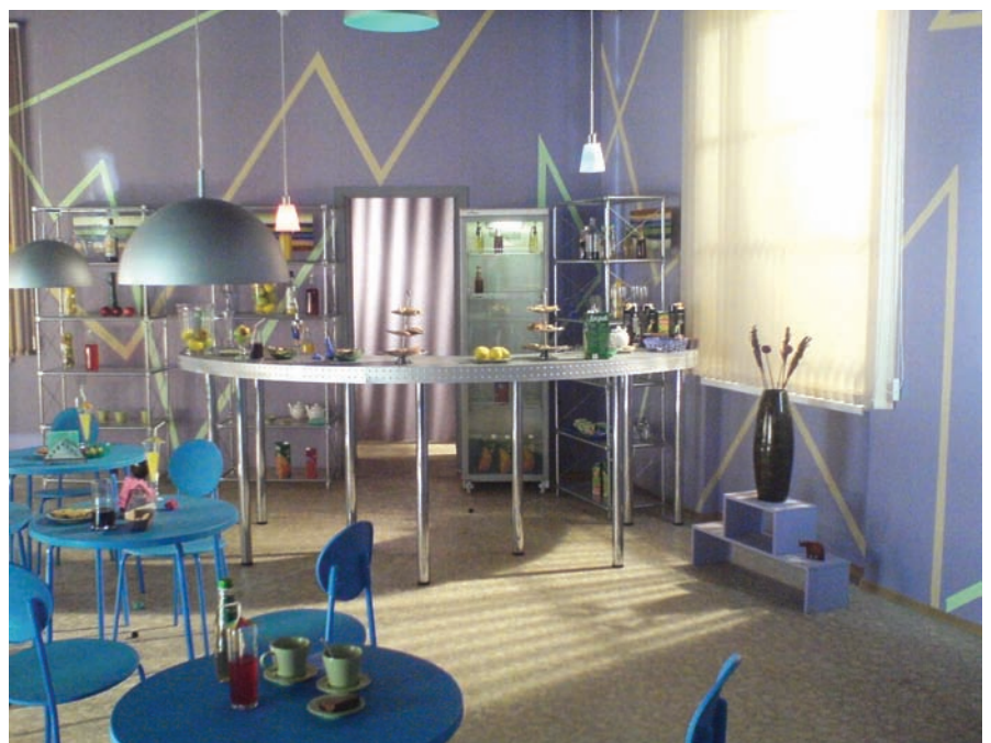
Солнечное настроение в декорации буфета