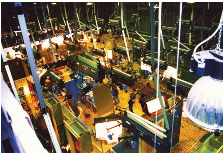
Лабиринт из декораций в павильоне мосфильма

эффекта разными способами. В декорациях процесс значительно упрощается – существуют леса, колосники, решетки или топ-лифты – располагать осветительные приборы можно где угодно. При съемке в квартире, офисе или ином готовом интерьере задачу усложняет специфика предлагаемого объекта – необходимость спрятать приборы за кадром ограничивает возможности оператора в выборе места для камеры. В этих случаях активно применяются различные крепежные приспособления.