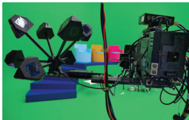
Камера Ikegami GFCam с инфракрасными излучателями

Хочется сказать несколько слов о самой лотерее – тут все не просто честно, а очень честно. Прежде всего, это первая в России лотерея, которая полностью снимается в виртуальной студии. Кроме того, в «Бигабум» нет никаких лототронов, шаров, бочонков и других физических объектов, служащих для выявления выигрышей. Перед началом съемки шоу система графического оформления в реальном времени