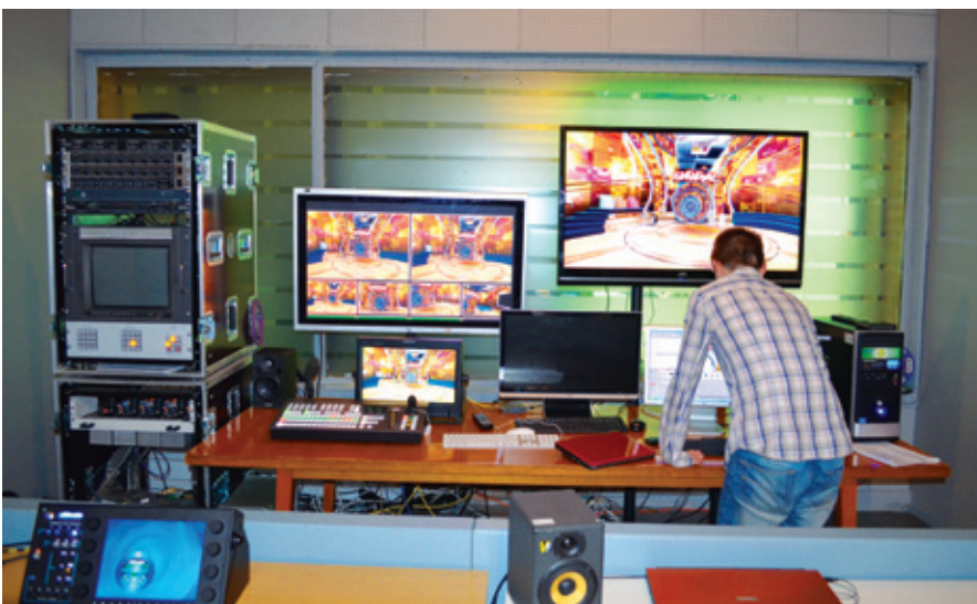
Аппаратная технологического комплекса

В завершение следует отметить, что профессионализм специалистов из IS-Cool, помноженный на эффективность, функциональность и надежность оборудования ORAD, позволил создать телепрограмму, аналогов которой в России пока не было и нет.