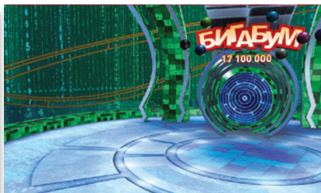
Павильон и изображение, полученное с помощью виртуальных технологий