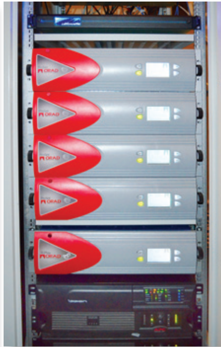
Системы ORAD в стойке с оборудованием

получает лотерейный файл из полностью автоматизированной системы Trusted Draw, автоматически заменяет его соответствующими символами и номерами так, чтобы их можно было графически представить на виртуальных объектах студии или в нижней трети экрана. Данные поступают в закодированной форме непосредственно в систему визуализации, вмешаться в которую не может никто. В итоге с момента поступления данных розыгрыша до отправки мастер-кассеты в вещательную аппаратную ТНТ проходит не более 3 ч. За это время программа снимается, монтируется и записывается на кассету. Задача облегчается тем, что никакого прорисовки (rendering) в системе не происходит – вся визуализация выполняется в реальном масштабе времени во время