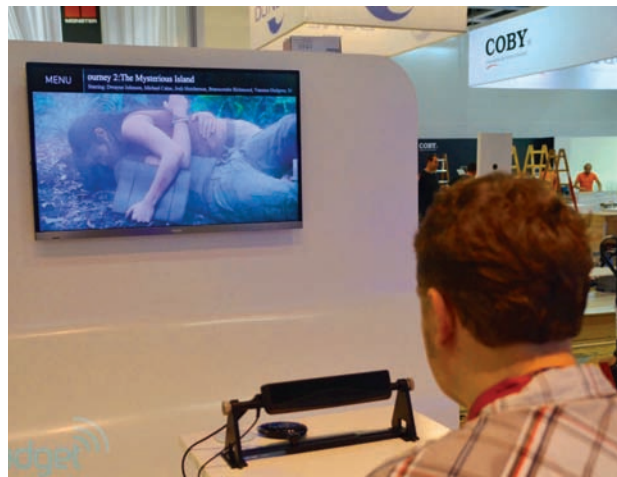
Телевизор Haier, управлять которым можно глазами

Надо сказать, что фирма Haier, показавшая в Берлине свой новый телевизор, уже имеет репутацию производителя новаторских устройств в области телевидения. В январе 2012 года на выставке бытовой электроники в Лас-Вегасе она представила первый полностью беспроводной телевизор. Он получает питание не через силовую кабель, а с помощью приемника микроволнового излучения, а для приема электронного сигнала используется формат