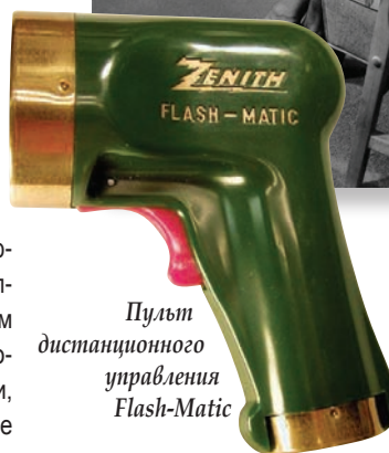
Пульт дистанционного управления Flash-Matic

кусств и наук как «Пионеры в области развития беспроводных пультов ДУ для телевизоров».