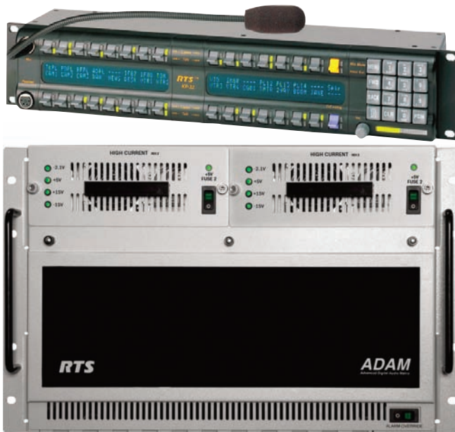
За историческим фасадом скрывается очень эффективное оборудование, включая две аудиоматрицы RTS ADAM и 200 консолей RTS серий KP-32, KP-12 and МКР-4

«Новой сценической системой можно управлять с любого из шести рабочих мест менеджеров, расположенных в разных частях театра, – говорит Томсен. – Протокол SNMP обеспечивает контроль над работой всех компонентов системы. Да и в целом вся система служебной связи RTS объединяется на основе SNMP в единую, легко управляемую инфраструктуру. При возникновении нештатной ситуации система способна проанализировать любое сообщение об ошибке и передать информацию в виде голосового сообщения, SMS или сообщения по электронной почте тому, кто отвечает за устранение неполадки». И хотя с начала ввода системы в эксплуатацию прошло совсем немного времени, инсталляция уже вызвала в профессиональной среде большой интерес. Она рассматривается многими как новая планка построения подобных систем. «К нам поступало уже несколько обращений, связанных с системой, созданной в Большом, –