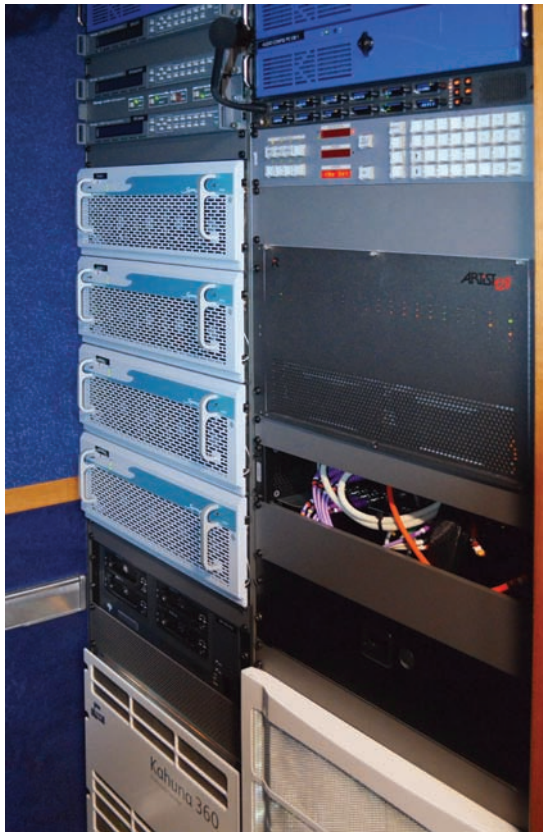
Системы Axon Synapse, установленные в одной из 10-камерных ПТС АНО «Спортивное вещание»

«Спортивного вещания». Все запчастки уже здесь и могут быть предоставлены заказчикам в любой момент, когда они им понадобятся.