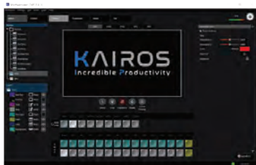
KAIROS Control (панель управления)