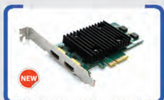
FD720 2 HDMI IN