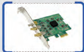
FD722 2 SDI/ASI IN + 2 SDI/ASI OUT