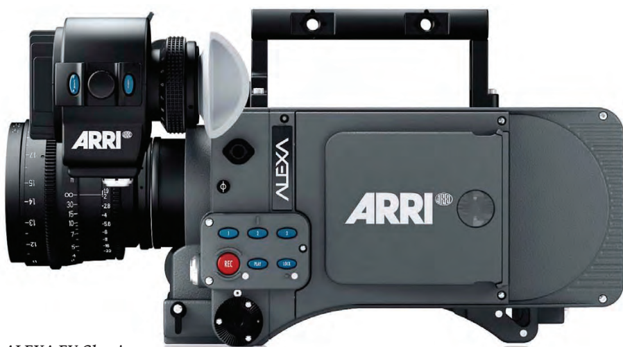
ALEXA EV Classic – одна из моделей, участвующих в программе ARRI Trade In

В программе достаточно много организационных и юридических нюансов, связанных в том числе и с внешнеторговой структурой данной сделки, включающей такие процедуры, как обратный выкуп, реэкспорт, импорт, сервисную оценку. На каждом этапе есть свои подводные камни. Накопленный компанией Sernia-Film опыт позволяет гибко реагировать на пожелания заказчиков и существенно снизить организационные, технические, логистические и прочие издержки. Чтобы узнать больше, можно связаться с компанией Sernia-Film.