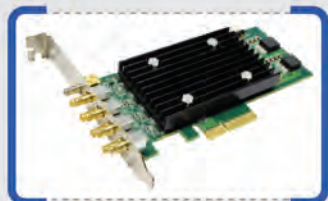
FD788 up to 8 SDI/ASI IN/OUT