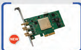
FD922 12G SDI