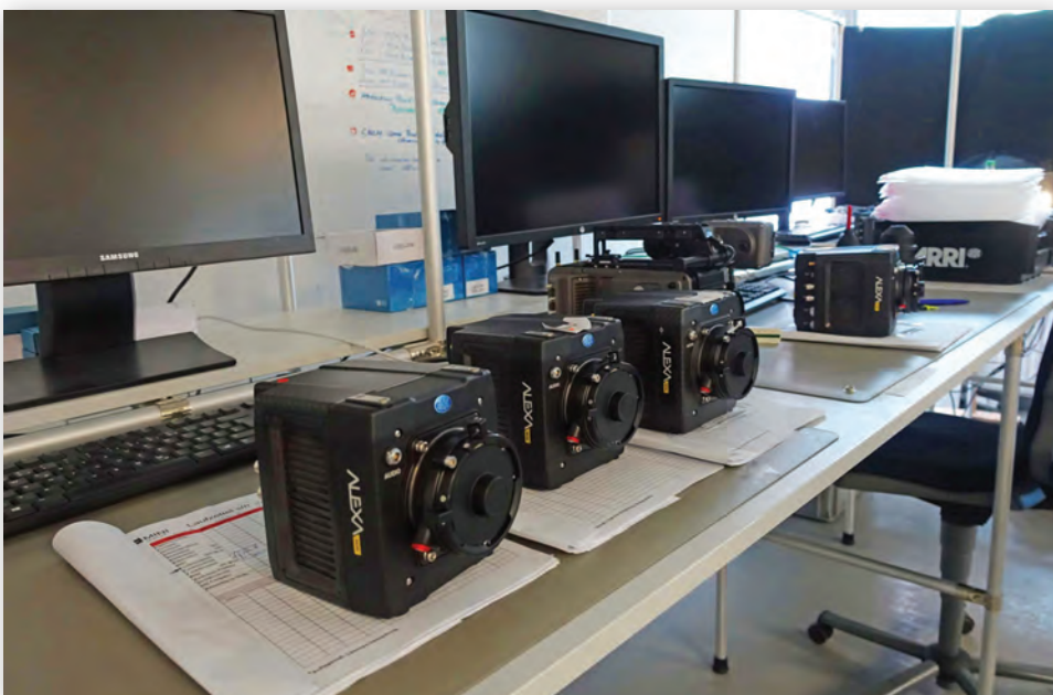
Камеры ALEXA Mini протестированы и готовы к отправке своим будущим владельцам