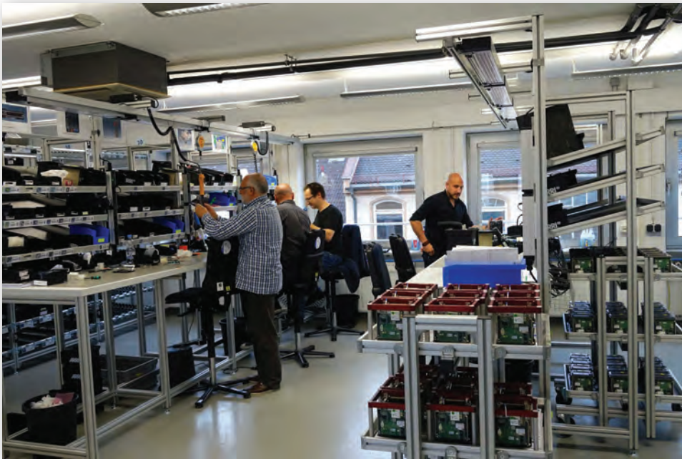
Завод ARRI по производству камер ALEXA Mini

сию. Иными словами, нельзя просто упаковать камеру в личный багаж, полететь в Мюнхен и там обменять ее на новую с доплатой, – сделки по программе Trade In проводятся исключительно официальными дилерами ARRI в регионе, то есть в России. Дилеры в свою очередь сопровождают каждую сделку с момента зарождения потенциального интереса до прибытия новой техники.