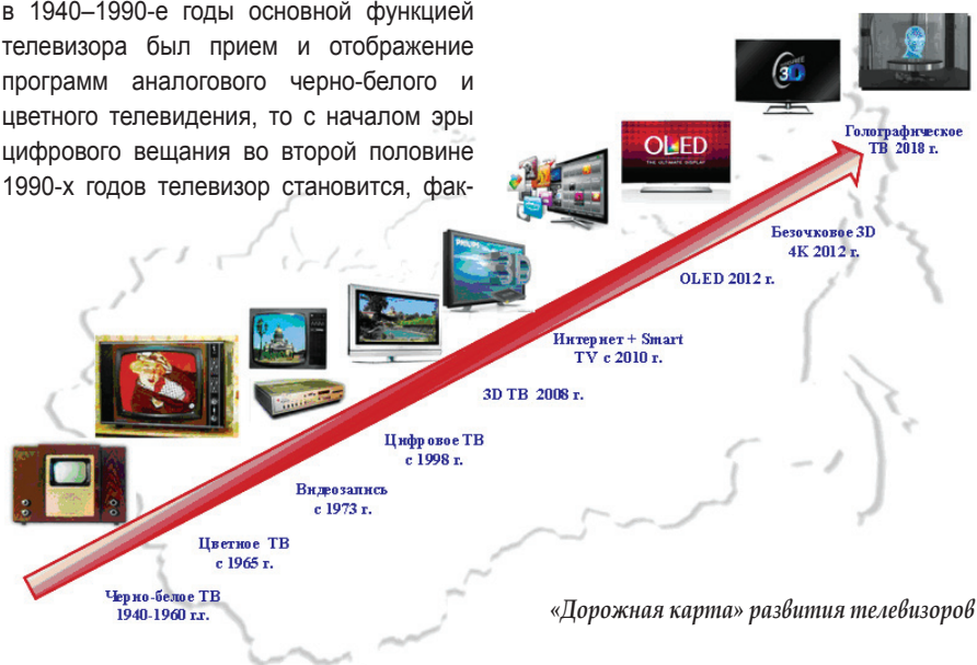
«Дорожная карта» развития телевизоров

Эксперты прогнозируют, что вследствие развития новых технологий в ближайшие 5 лет будет наблюдаться устойчивый спрос на телевизоры в объеме 270...300 млн шт./год. При этом больше 80% рынка придется на жидкокристаллические телевизоры (LCD) со светодиодной подсветкой (LED) и плазменные телевизоры (PDP). Однако в перспективе все большую конкуренцию им будут создавать дисплеи, созданные на базе