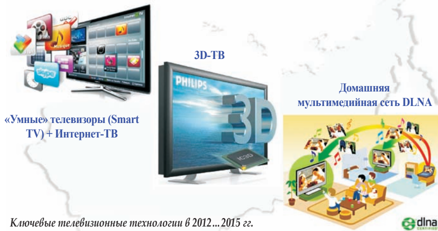
Ключевые телевизионные технологии в 2012...2015 гг.

новых физических принципов, в частности, органические дисплеи OLED (AMOLED).