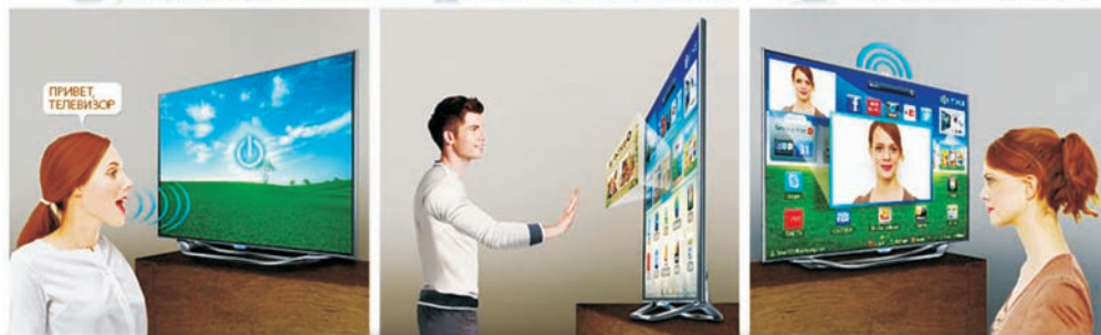
Новинки технологии Smart TV 2012 года от Samsung

Так как в новую технологию были инвестированы гигантские средства, доля Smart-телевизоров в производственных программах ведущих мировых производителей стремительно растет. Для примера: если в России в 2011 году из 8 млн проданных телевизоров на долю моделей Smart TV пришлось всего 0,5 млн шт., то в 2012 году их продажи вырастут уже как минимум до 1 млн шт. В ближайшие годы по прогнозам экспертов практически все из 8...10 млн шт. продаваемых в России телевизоров будут выполнены в соответствии с концепцией Smart TV. А в связи с внедрением в России к 2015 году цифрового телевизионного вещания спрос на цифровые Smart-телевизоры может еще больше возрасти.