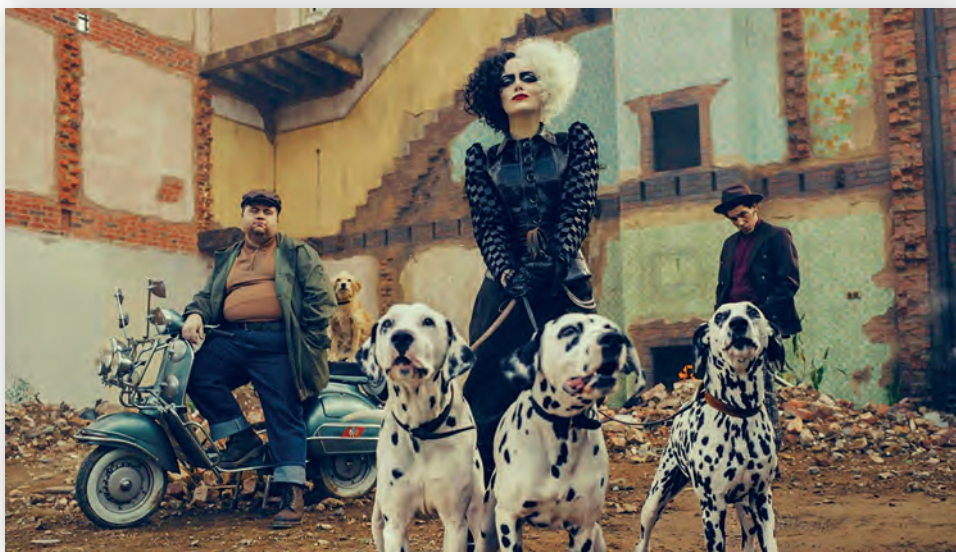
Кадры из фильма