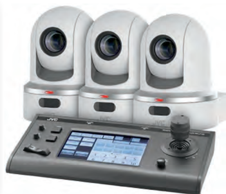
PTZ-камеры KY-PZ100 и контроллер RM-LP100U