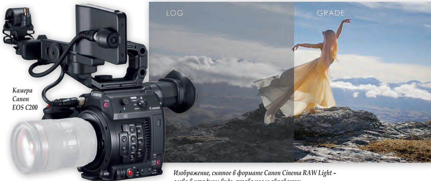
Изображение, снятое в формате Canon Cinema RAW Light – слева в исходном виде, справа после обработки

Кроме записи Cinema RAW Light, C200 также снимает 4K UHD (4:2:0, 8 бит, 150 Мбит/с) и HD в MP4. Более компрессированный, чем CRM, файл MP4 можно сохранять на недорогих картах SD, продающихся повсеместно. Универсальность MP4 расширяется, если в камере выбрать кривую Canon Log. Тогда снятый материал имеет низкие контрастность и насыщенность, но содержит больше цветовой информа-