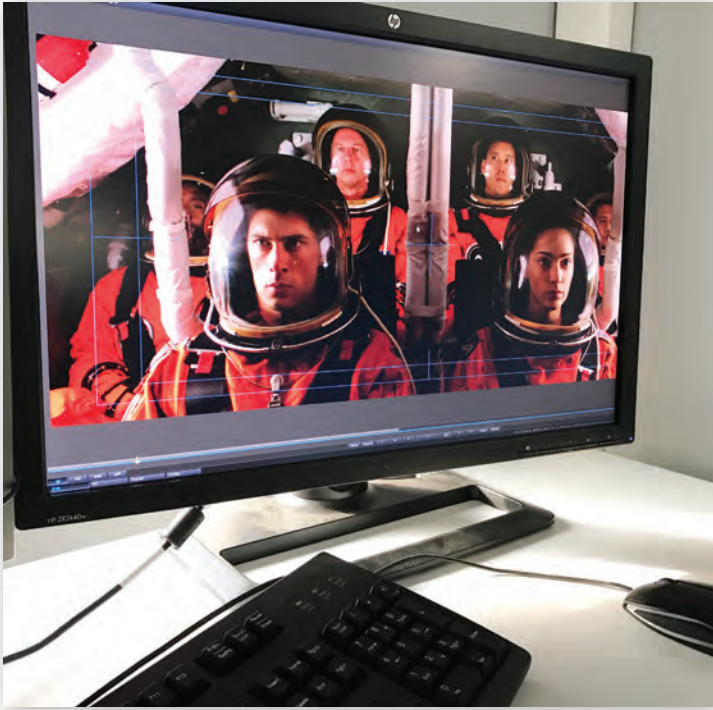
Просмотр материала в системе Spycer