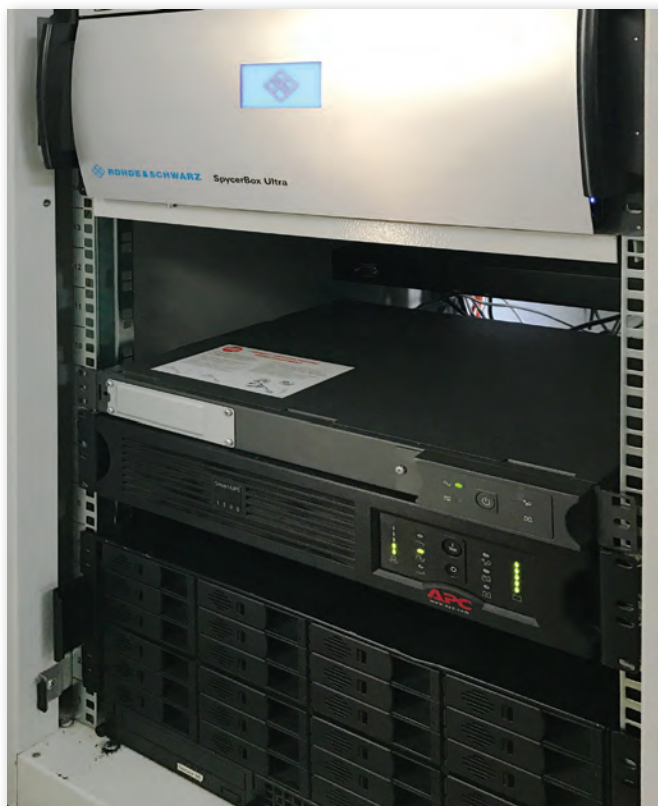
Система хранения SpycerBox Ultra