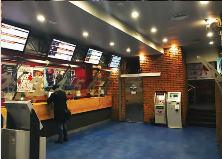
Кинотеатр «Пять звезд-Павелецкая»

редачки готовых видеоматериалов заказчику, оперативно отслеживать их качество. В определенной мере это решение повлияло и на объем сделок, техническую сторону которых «Парадиз» теперь решает оперативно благодаря новому департаменту. В планах – расширение функциональности Департамента обработки, хранения и доставки цифровых материалов.