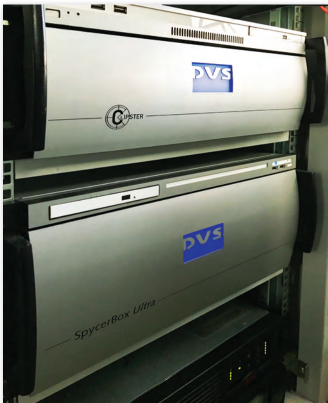
Станция R&S Clipster

После внедрения комплекса и обучения сотрудников, компания взяла на себя существенную часть тех работ по подготовке материалов для кинопроката и дистрибуции на ТВ и в Интернете, что ранее выполнялись сторонними подрядчиками. Оптимизация позволила уменьшить сроки пе-