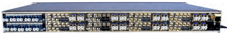
Панель интерфейсов полноразмерного шасси miniHUB

В портфеле Norwia есть несколько устройств и решений, но наиболее интересными, вероятно, можно считать miniHUB и HUBbox.