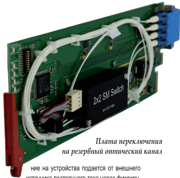
Плата переключения на резервный оптический канал

Устройства HUBbox MkII содержат высококачественные оптические компоненты, выполняют автоматическую коррекцию потерь в кабеле, автоматически же отсекают сигналы с нестандартными для SDI кадровыми частотами, обеспечивают два выходных сигнала SDI или сквозной тракт для SDI с восстановлением тактовой частоты. Светодиодные индикаторы на корпусе информируют о наличии питания и состоянии синхронизации SDI. Пита-