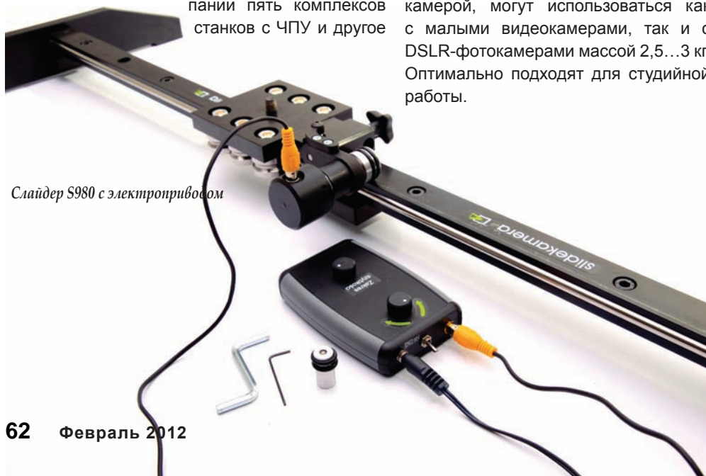
Слайдер S980 с электроприводом

Это хорошие слайдеры для полупрофессионального применения. Они обеспечивают точное, мягкое и бесшумное перемещение каретки с камерой, могут использоваться как с малыми видеокамерами, так и с DSLR-фотокамерами массой 2,5...3 кг. Оптимально подходят для студийной работы.