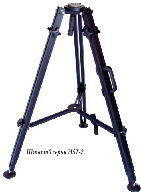
Штатив серии HST-2

Панорамная головка HGO-2, изготовленная из алюминия, предназначена для использования с кранами,