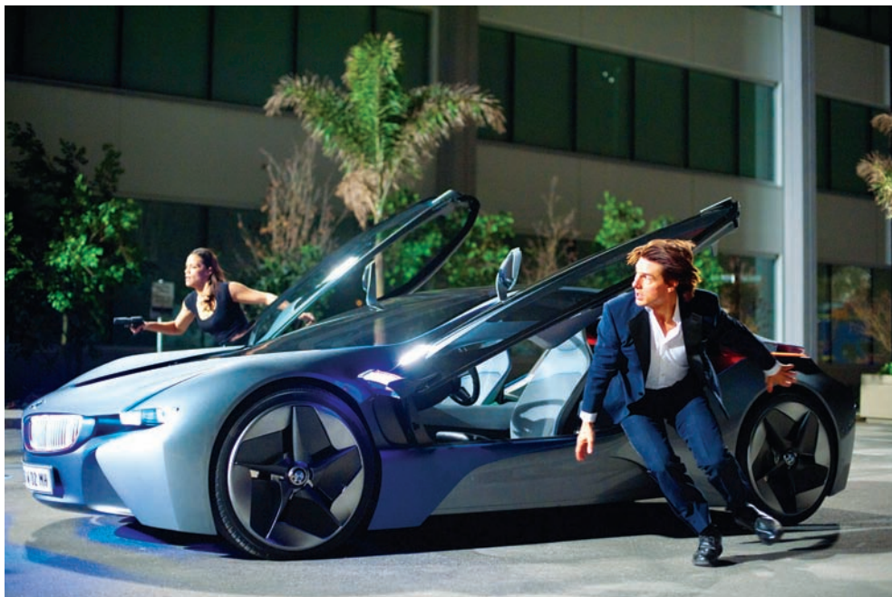
BMW i8 – автомобиль настоящего штиона

«Мы усилили бурю, чтобы скрыть осветительное оборудование в глубине кадра, – признается Джон Нолл, – помимо этого приложили руку ко второй половине погони, когда Хант преследует злодея пешком. Применяли элементы из нашей библиотеки эффектов, а в некоторых случаях прибегали к цифровому шуму, который генерировали на этапе монтажа».