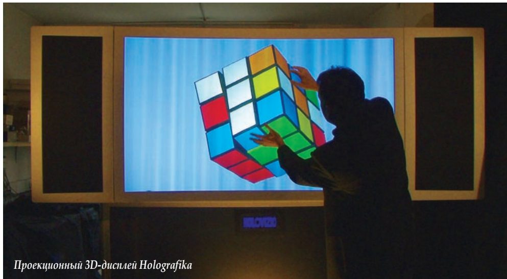
Проекционный 3D-дисплей Holografika

создать многоракурсные 3D-дисплеи. Визуальное качество изображения в них кардинально зависит от количества пикселей матрицы, поскольку визуально 3D комфортно при приближении к 40 ракурсам, к чему сегодня не может даже приблизиться ни один серийный дисплей. А производителям дисплеев нечего показывать на дисплеях с большим количеством мегапикселей. Кроме того, качество переходов между ракурсами в многоракурсном дисплее существенно зависит от расположения субпикселей (оно должно быть иным, нежели в обычных дисплеях). И здесь подход SubPixel rendering весьма применим.