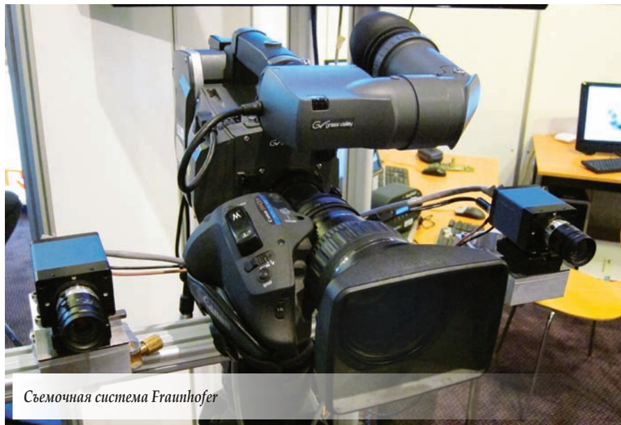
Съемочная система Fraunhofer